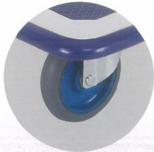
エアークャスター:107φ

サイズ:w740×D480×H850mm 自重:12.3kg 積載荷重:150kg