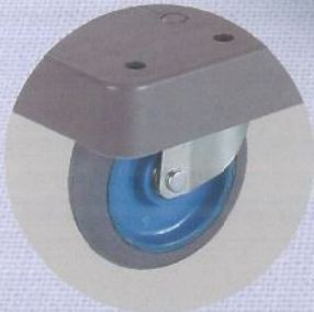
エアークャスター:107φ