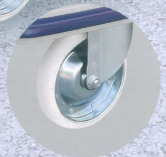
エアークャスター:200φ

サイズ:w1240×D790×H880mm 自重:40.3kg 積載荷重:500kg