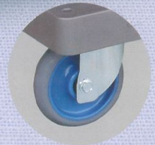
エアークャスター:125φ