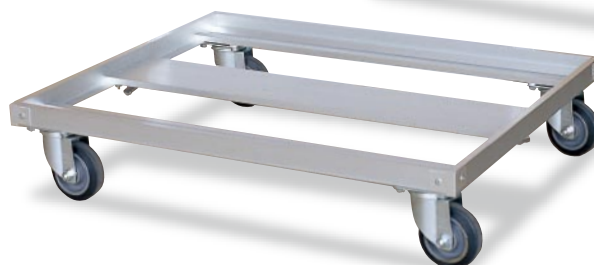
オールアルミタイプ