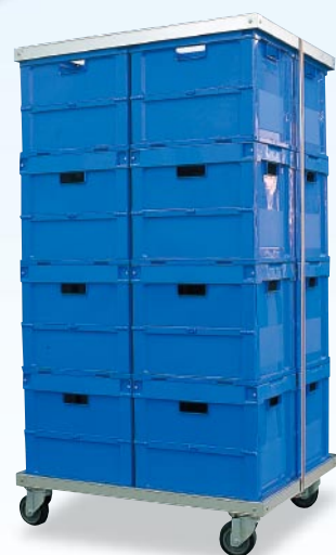
使用例 ＜オリコン積載時＞

キャスター：75φナイロン車輪自在車／75φゴム車輪自在車 ※キャスターはエアーキャスター(軽量特殊鋼)標準仕様