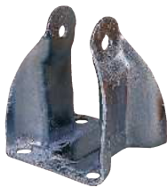
カラーコーティングなし 72時間白錆発生