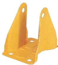
カラーコーティングあり 144時間白錆発生変化なし