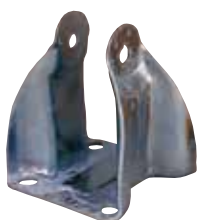
カラーコーティングなし 72時間白錆発生