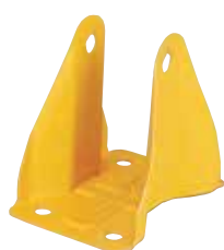
カラーコーティングあり 144時間白錆発生変化なし