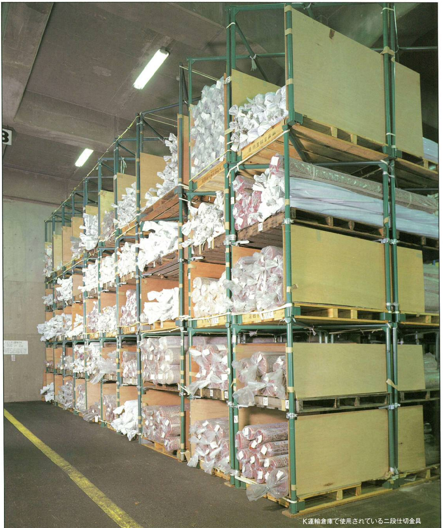
K運輸倉庫で使用されている二段仕切金具